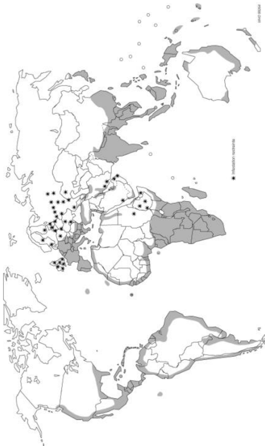
Carte 2 Répartition de Rattus rattus

Les désignations utilisées sur cette carte et la présentation des données qui y figurent n'impliquent, de la part de l'Organisation mondiale de la Santé, aucune prise de position quant au statut juridique de tel ou tel pays, territoire, ville ou zone, ou de ses autorités, ni quant au tracé de ses frontières. Les lignes en pointillés représentent les frontières sur lesquelles un accord complet peut ne pas encore exister.