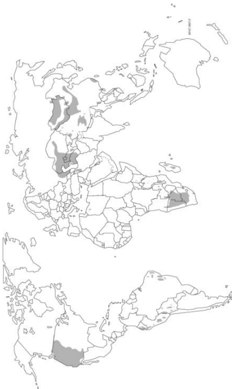
Carte 1 Foyers naturels de la peste (chez les populations de rongeurs)

Les désignations utilisées sur cette carte et la répartition des données qui y figurent n'impliquent, de la part de l'Organisation mondiale de la Santé, aucune prise de position quant au statut juridique de tel ou tel pays, territoire, ville ou zone, ou de ses autorités, ni quant au tracé de ses frontières. Les lignes en pointillés représentent les frontières sur lesquelles un accord complet peut ne pas encore exister.