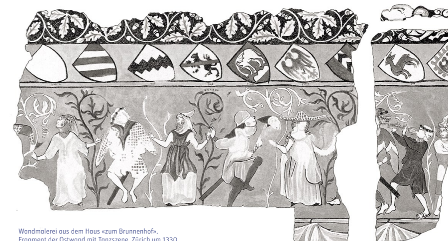
Wandmalerei aus dem Haus «zum Brunnenhof». Fragment der Ostwand mit Tanzszene, Zürich um 1330

Ein Stadtrundgang mit Synagogenbesichtigung, mit Ralph Weingarten