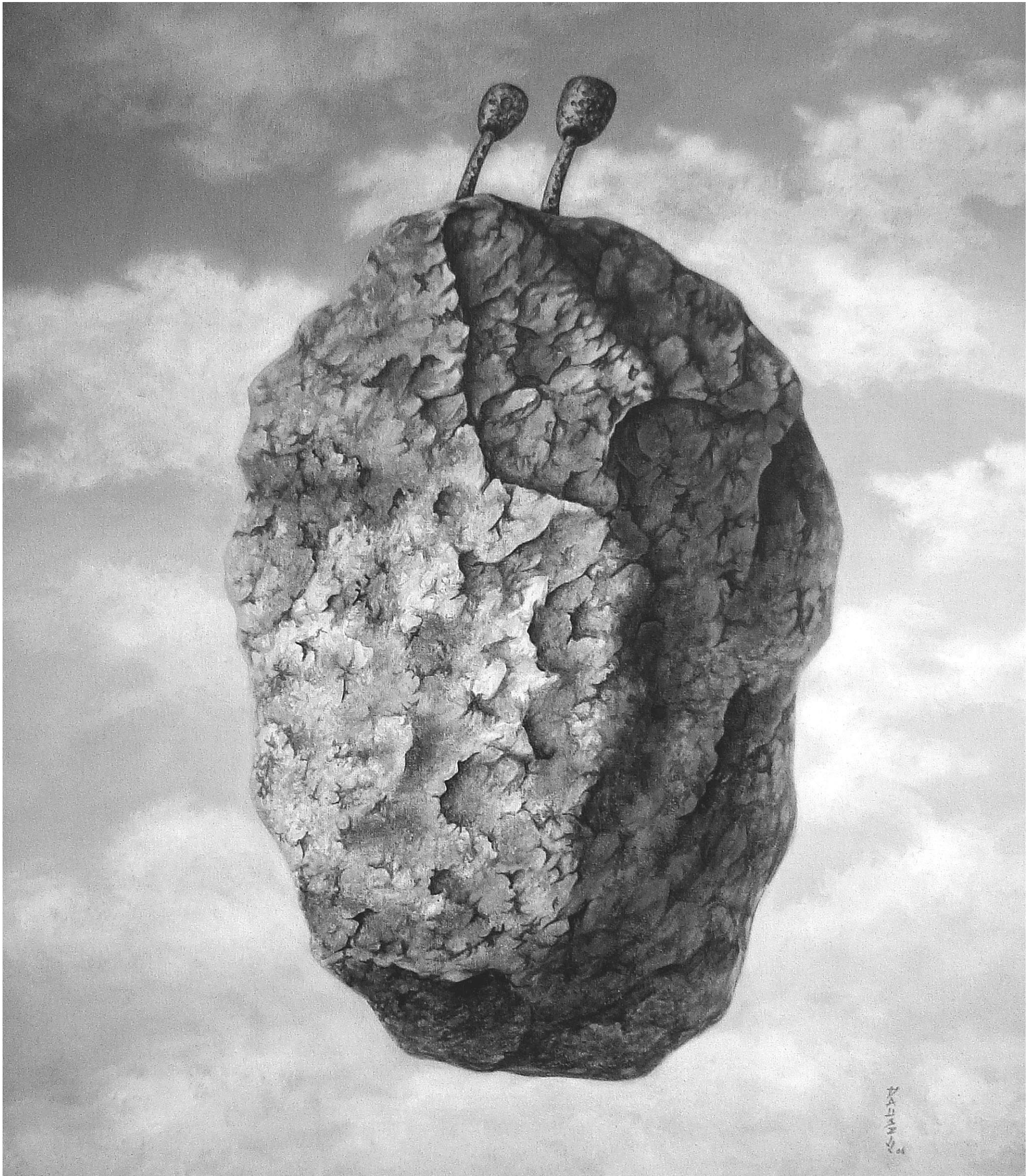
«La voz de los vientos». Óleo/lienzo 2006 66 x 54,5cm Autor: Dausell Valdés.

«Las ideas justas se transforman en roca y viajan con esa firmeza en el viento y a través de los siglos como voces que retumban en el universo para iluminar las almas nobles».